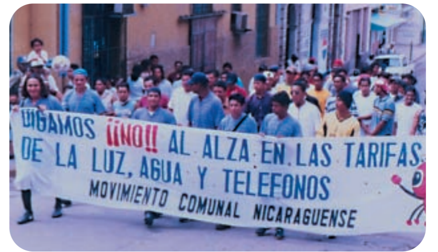
Jongerdemonstratie tegen prijsverhoging van water, licht en telefoon. Matagalpa, Nicaragua.

Meer lezen: Wamukonya, N. (ed.), Electricity reform: social and environmental challenges , United Nations Environment Programme, UNEP Risoe Centre, Roskilde, June 2003 http://uneprisoe.org/SectorReform/ElectricReformChallenges.pdf